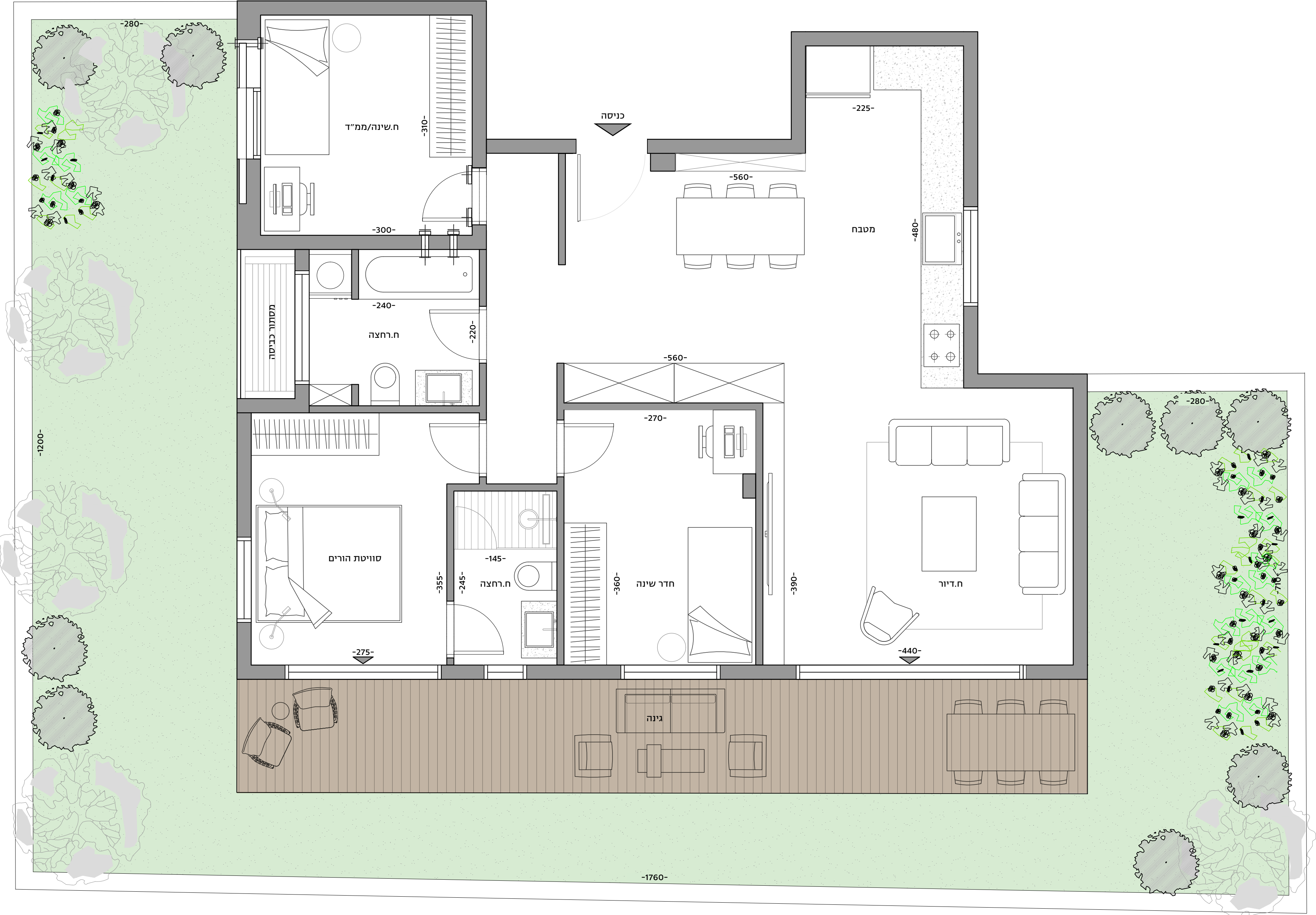
פנחס רוטנברג 44/46